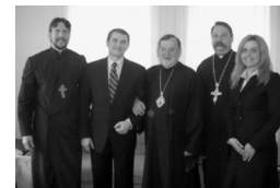
Metropolitan Constantine of the Ukrainian Orthodox Church of the USA greets Dr. Shamshur