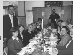
Sts. Peter & Paul's Ukrainian Orthodox Church, Carnegie