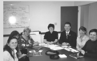
The Bayer Center for Non-Profit Management at Robert Morris