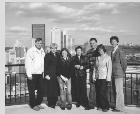
Atop Mt. Washington

- Група здійснила екскурсію центру міста Пітсбурга у день свого приїзду, яка дозволила делегатам ознайомитись з історичним розвитком Пітсбургського регіону. При цьому особлива увага була звернена на історичну спадщину міста і його адаптацію в зв'язку з занепадом сталеплавильної індустрії. (продовжено на стор.3)